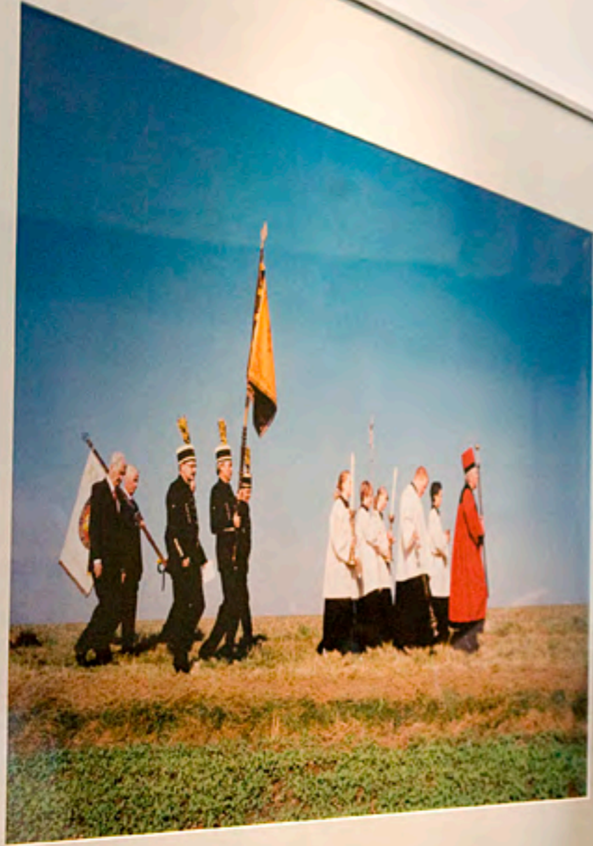
John G. Thompson 2005