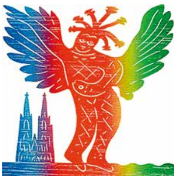
© Heinz Stein: „Engel der Narren“, Holzschnitt

„Tausend Narrenkappen sind mir lieber als ein Stahlhelm.“