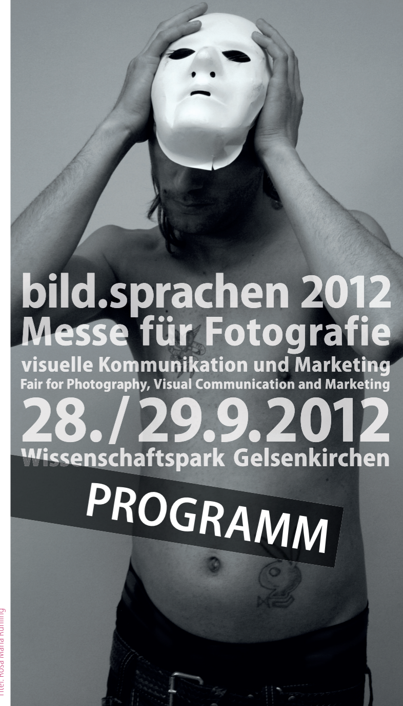
bild.sprachen 2012 Messe für Fotografie visuelle Kommunikation und Marketing Fair for Photography, Visual Communication and Marketing 28./29.9.2012 Wissenschaftspark Gelsenkirchen