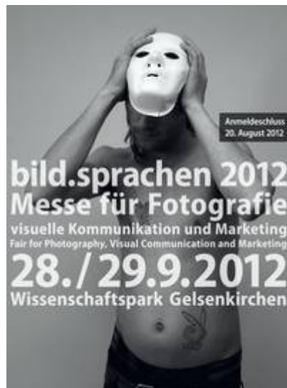
bild.sprachen 2012 - Messe für Fotografie, visuelle Kommunikation und Marketing