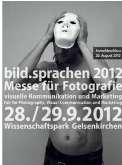
bild.sprachen 2012 - Messe für Fotografie, visuelle Kommunikation und Marketing